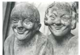
Die Erlösten am Bamberger Dom